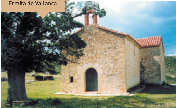
Ermita de Vallanca

Casas Bajas es el primer núcleo urbano que el viajero encuentra cuando entra en el Rincón procedente de Valencia. Situado sobre la margen derecha del río Turia, su territorio ofrece parajes naturales de gran interés, como Las Cambretas, El Carrascalejo, La Peña Alta, La Chopera del Molino, La Covatillas, La Barraca Grande, La Rambla y El Pozo Salado.